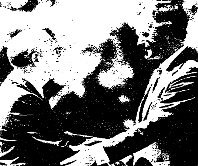
الرئيسان الاميريكي وغورباتشوف اثناء لقاء التشيد الوطني للبلدين

اعلن البيت الابيض اسم ان الرئيس الاميريكي جورج بوش والزعيم السوفياتي ميخائيل غورباتشوف يوقعا اتفاقا تاريخيا يوقعان فيه على اتفاقات اليوم وريعا يكون بينها ايضا اتفاق مبدئي بشأن خفض الصواريخ النووية بعيدة المدى. وقال مرلين فيتزوتروير السكرتير الصحفي للبيت الابيض في لقاء مع الصحفيين، ان الرئيس بوش وغورباتشوف يامنان بان يتصلا على تحديد اطر عام لاتفاقية تحظر على الصواريخ الاستراتيجية (ستارت) الاسلحة الاستراتيجية ستحذف مخزون الدولتين العظيم من الغارات السامة وعلى اتفاق بشأن تجارب الاسلحة النووية وعلى برنامج لنقل الوقود النووي وتراست الطيران والمحيطات.